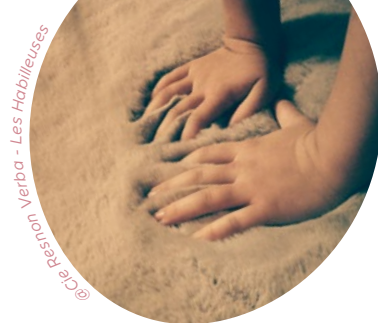
@ Cie Resnon Verba - Les Habilleuses