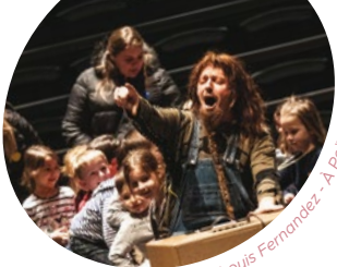
@Jean-Louis Ferronbez - A Poils