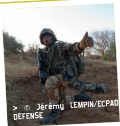
> © Jérémie LEMPIN/ECPAD DEFENSE

Vendredi 10 novembre à 20h15 aux 400 coups à Angers