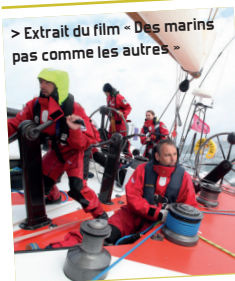
> Extrait du film « Des marins pas comme les autres »

Jeudi 16 novembre à 20h au cinéma Le Palace à Château-Gontier